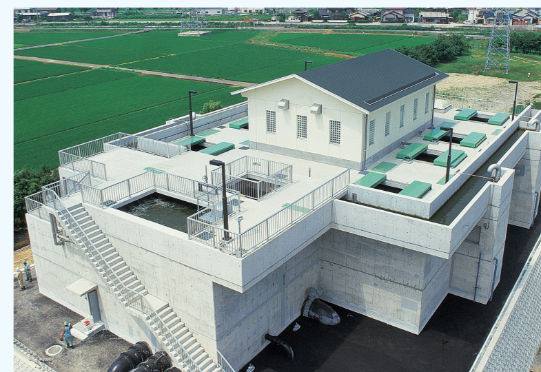
本城浄水場 上向流式生物接触ろ過池

上向流式生物接触ろ過装置(U-BCF)は、平成18年7月21日に本市が特許権を取得しています。