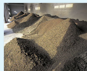
ケーキヤード(脱水污泥ヤード)