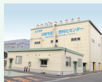
日明汚泥燃料化センター