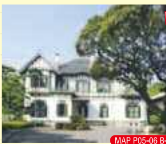
MAP P05-06 B-2

📞093-871-1031（西日本工業倶楽部）📍JR戸畑駅よりバスで約9分。明治学園前バス停下車、徒歩約5分