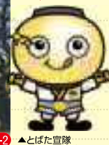
▲とばた宮隊 ちようちゃんジャー