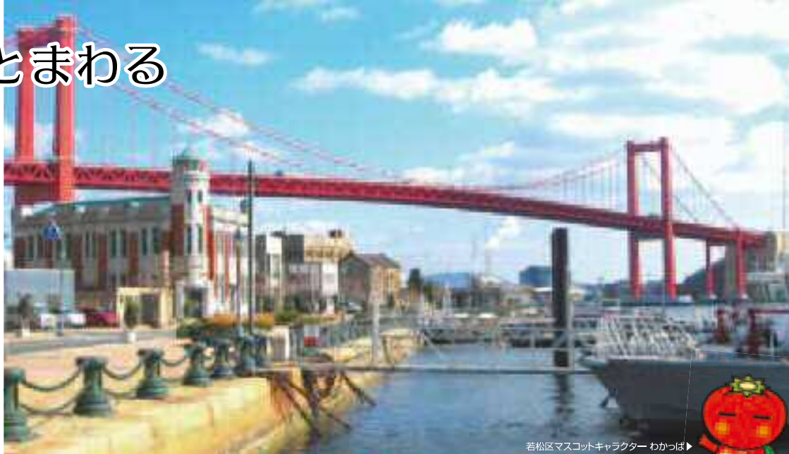
若松区マスコットキャラクター わかつば

かつて日本一の石炭の積出港として栄えた若松、そして洞海湾にかかる赤色のシンボル・若戸大橋でつながる戸畑は、どこか懐かしさの漂うエリアです。市内唯一の海水浴場や芸術・文学・歴史と、多彩な楽しみ方ができます。