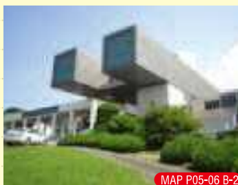
MAP P05-06 B-2

市街を見下ろす自然豊かな丘陵に建つ、ユニークな形をした美術館。ルノワールの「麦わら帽子を被った女」やドガの「マネとマネ夫人像」、モネの「睡蓮、柳の反影」など、世界の名作を所蔵。