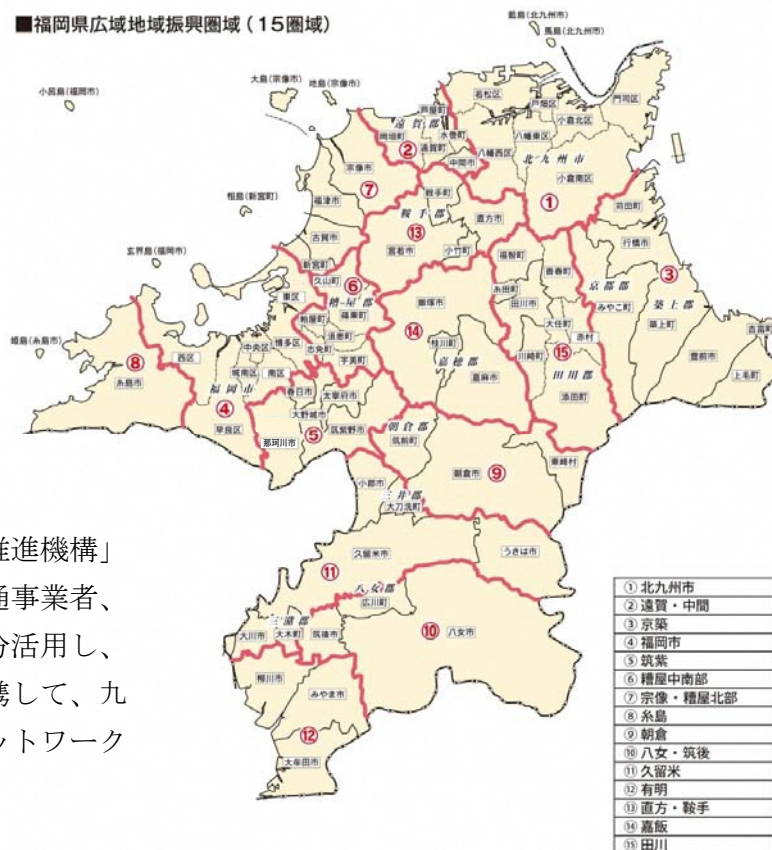
福岡県広域地域振興圏域(15圏域)

県内の交通関係事業者、有識者、行政機関などで構成する「福岡県交通対策協議会」において、交通ビジョンに掲げた施策の進捗状況、具体的成果、解決すべき課題を確認しながら、PDCAサイクルにより、施策の実効性を高めます。