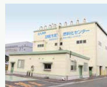
日明汚泥燃料化センター