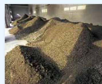
ケーキヤード(脱水汚泥ヤード)