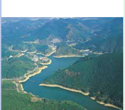
力丸貯水池 昭和40年度完成