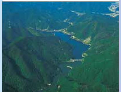
ます湖貯水池 昭和48年度完成