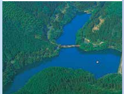
道原貯水池 明治45年度完成