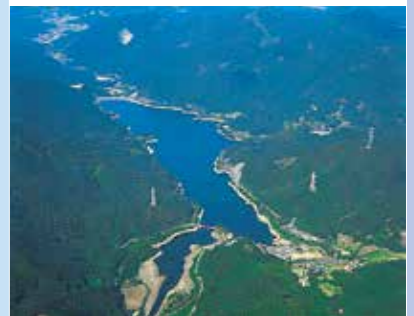
油木貯水池 昭和46年度完成