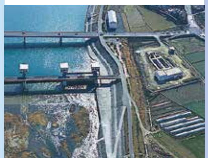
平成大堰 平成2年度完成