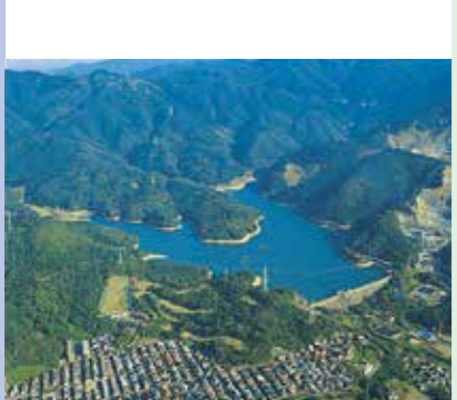
畑貯水池 昭和30年度完成