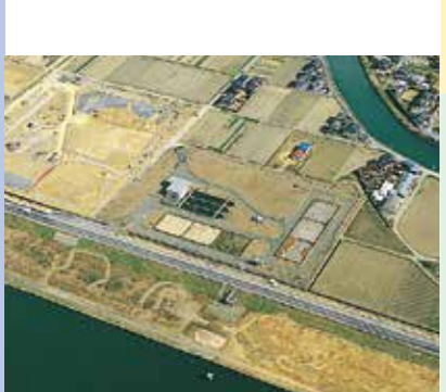
猪熊取水場 昭和57年度完成