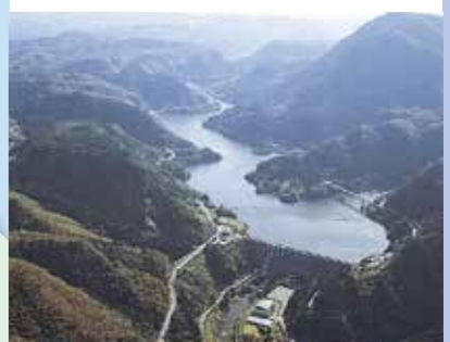
耶馬溪貯水池 昭和60年度完成