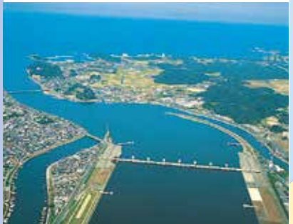
遠賀川河口堰 昭和57年度完成