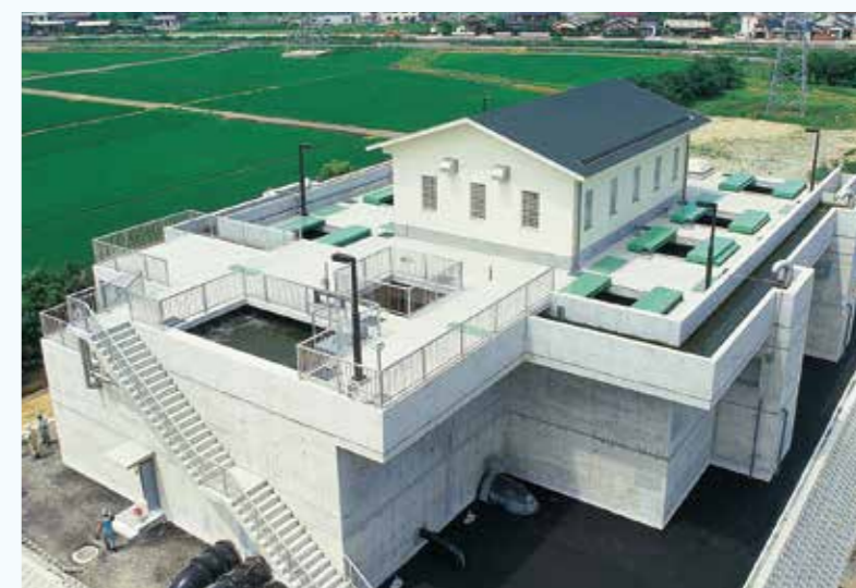
本城浄水場 上向流式生物接触ろ過池

上向流式生物接触ろ過装置(U-BCF)は、平成18年7月21日に本市が特許権を取得しています。