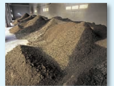
ケーキヤード(脱水汚泥ヤード)