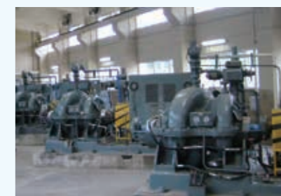
穴生浄水場 インバータポンプ

さらに、送水ポンプ以外にも沈でん池への電力が不要な水流エネルギーを利用した攪拌方式の導入や、東西連絡管の有効利用による送水系統の簡略化、配水ブロックの変更などを駆使して省エネルギー及び温室効果ガス排出削減に取り組んでいます。