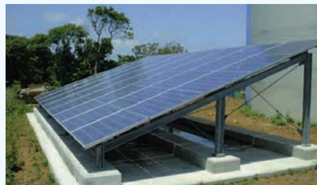
紫川太陽光発電(平成11年 新エネ大賞 新エネルギー財団会長賞 受賞) 藍島太陽光発電