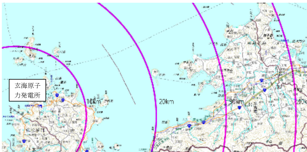
【 第1図 個別計画を事前に策定すべき地域の範囲 】

※ 本図は、国土地理院九州地方測量部から防災用として提供を受けた基盤地図を使用して作成されています。本図は、防災目的に限り利用できます。