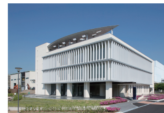
ビジターセンター外観

プロジェクションマッピングや、1時間に73ミリの豪雨を体験できる降雨体験装置などを備え、下水道について楽しく学べる体験型施設です。令和3年10月に見学者2万人を達成しました。