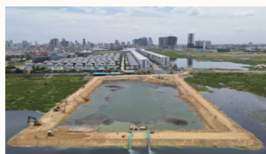
カンボジア下水処理場の建設状況

また、現在日本政府により首都プノンペンで初となる公共下水処理場が造られており、北九州市もこのプロジェクトに参画しています。