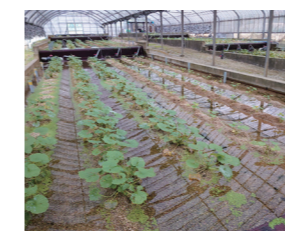
井手浦浄水場 (わさび園)

水は私たちの毎日の生活に欠かせない大切な資源です。浄水場では、「水の大切さ」や「安全で安心な水づくり」を楽しく学べます。