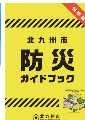
防災ガイドブック

※ 河川の水位変化を緑色のグラフで表しています。早めの避難行動にご活用ください。(10分毎に更新)