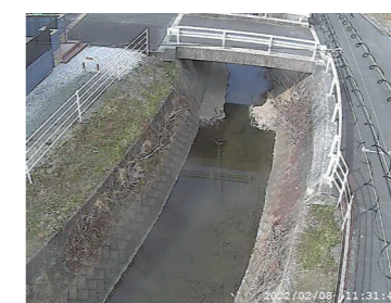
河川のライブカメラ映像