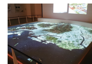
大迫力のプロジェクションマッピング