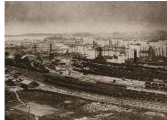
下水道が始まった大正初期の若松