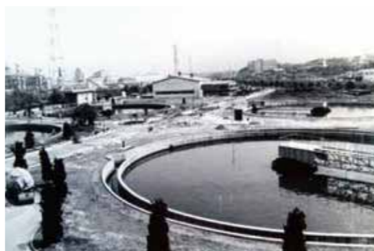
昭和38年皇后崎下水処理場運転開始 北九州市で初の下水処理場