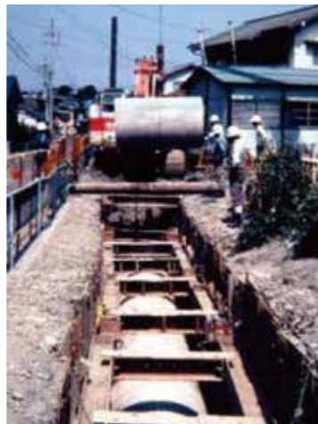
昭和57年頃 下水道の整備状況