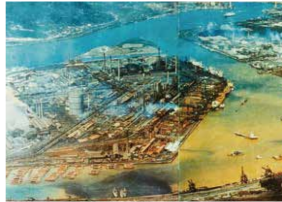
汚染された洞海湾