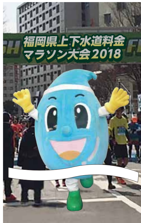
北九州市上下水道局マスコットキャラクター「スイッピー」