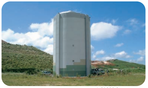
平尾台配水池 (小倉南区)