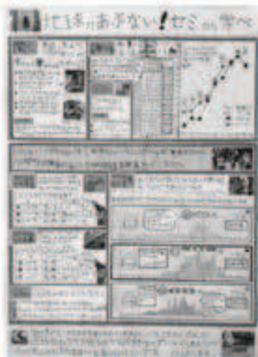
地球があぶない！セミから学べ