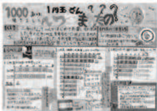
1円玉さんいつ生まれたの？