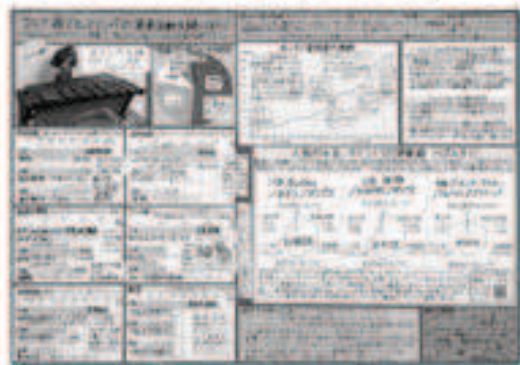
コロナ禍でも、マリンバの演奏活動を続けよう！ ～YouTubeでのマリンバ演奏～