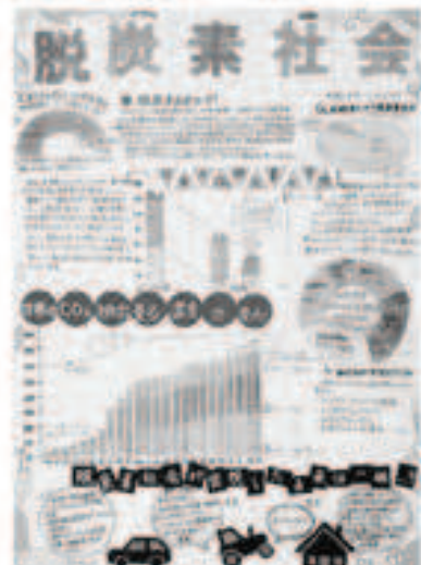
～実現しよう、地球に優しい社会～ 脱炭素社会