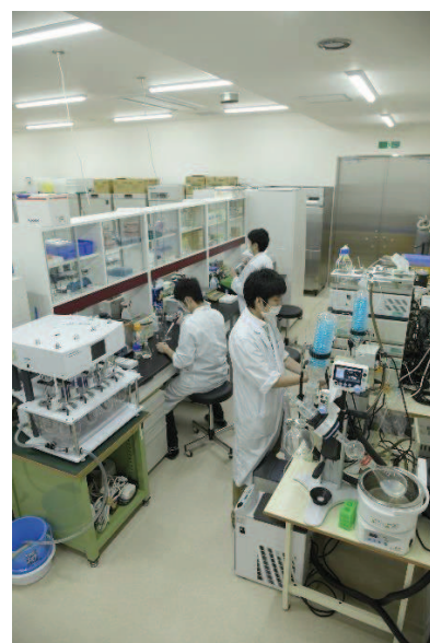
福岡バイオイノベーションセンター(建物外観・研究風景)