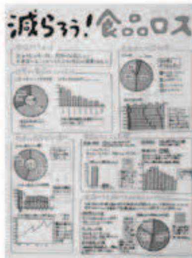
減らそう！食品ロス