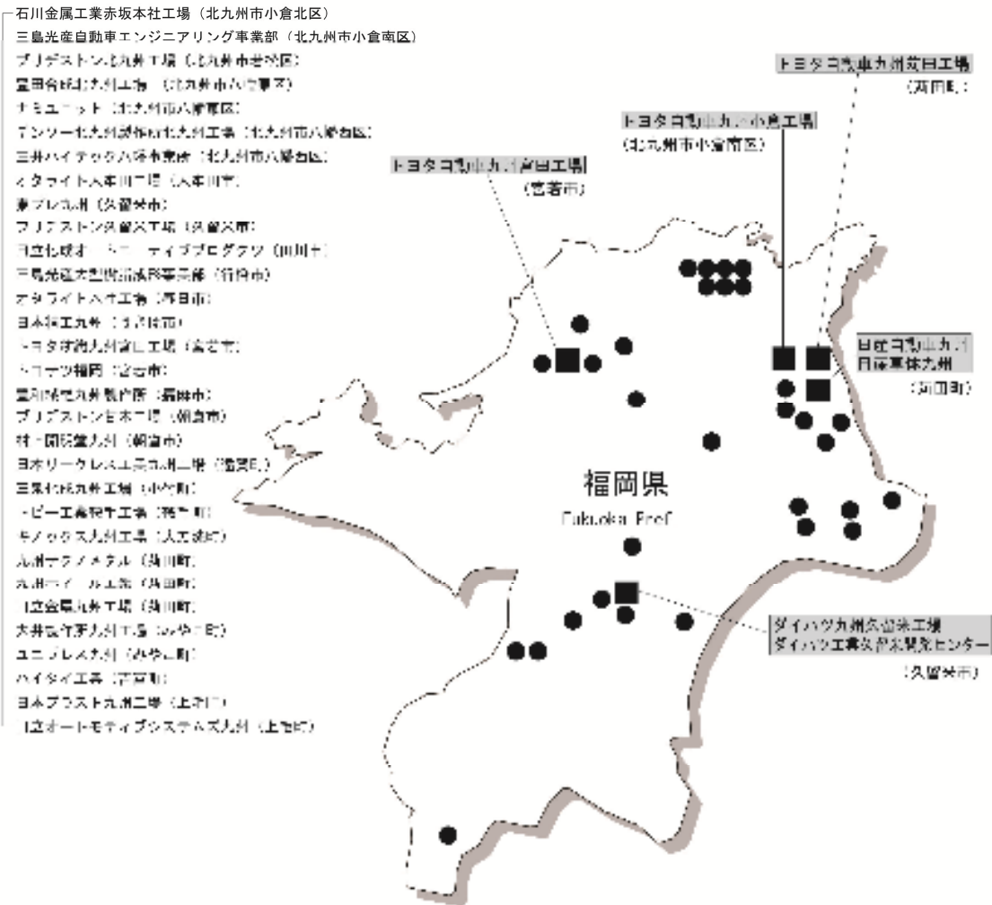
資料) 九州経済調査協会